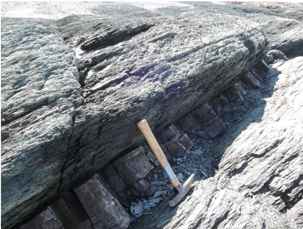
Figure 2. Shale de la pointe de l'Islet avec un lit discontinu de calcaire.

Ici, nous avons affaire à une pélite fissile appelée shale, c'est-à-dire une roche à grains très fins qui se débite en couches minces ou en feuillets. Elle est fissile parce qu'elle contient beaucoup de minéraux argileux. Les minéraux argileux sont des micas très petits, quasi invisibles à l'œil nu. Les micas ont cette particularité de se déposer à plat et leurs surfaces sont chargées électriquement, de sorte qu'elles se collent facilement les unes aux autres. Elles forment ainsi des couches avec des cristaux qui ont presque tous la même orientation.